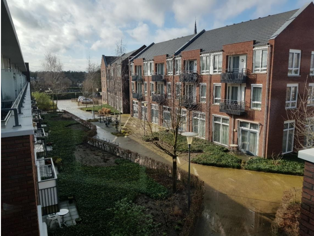
Afbeelding 1.4: Woningen voor de oudere doelgroep in het Hof van Bethanië in de gemeente Mierlo.

Compaen heeft voldaan aan de opgave en verdient een pluspunt voor de wijze waarop het zich heeft ingezet om de woningvoorraad in zowel nieuwbouw als bestaande bouw beter geschikt te maken voor de oudere doelgroep.