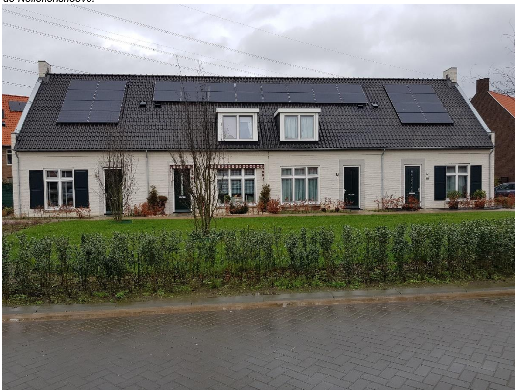
Afbeelding 1.1: Sociale nieuwbouwwoningen van Compaen vallend binnen project Stepekolk in Helmond aan de Nollekenshoeve.

Compaen heeft daarnaast gedurende de visitatieperiode diverse nieuwbouwprojecten opgestart, in voorbereiding of in de pijnpijn. Dit betreft onder andere de voorbereiding voor het opleveren van de 4 woningen in Stiphout-Zuid (zie tabel 1.4) die is getroffen in 2019. De bouw is gestart in maart 2020 en oplevering wordt verwacht in 2021. Binnen dit project bevinden zich ook 4 koopwoningen. Daarnaast betreft dit een divers scala aan andere plannen en projecten met onder andere biobased circulaire multifunctionele woningen, seniorenwoningen, sloop/nieuwbouw, transformaties en nieuwe woningen in het dorpsplein Mierlo-Hout. Een uitgebreide lijst is te vinden in bijlage 3, pagina 85.