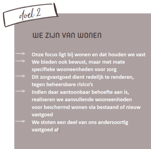
Figuur 2. Voorbeeld strategische doelstellingen: Ondernemingsplan Compaen 2017-2027, doelstelling 2

kwaliteit en passendheid van de doelstelling, omdat deze meer strategisch van aard zijn. Een voorbeeld is opgenomen in Figuur 2.