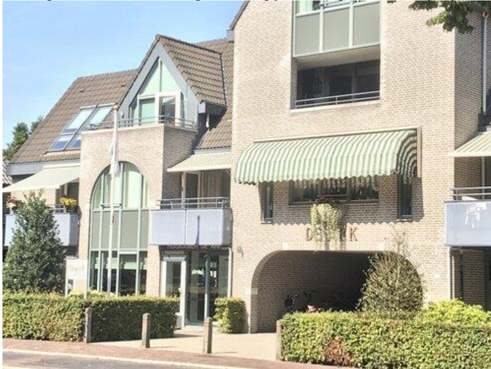
Afbeelding 1.6: Huiskamer De Ark die fungeert als belangrijke ontmoetingsruimte voor de wijk Stiphout.