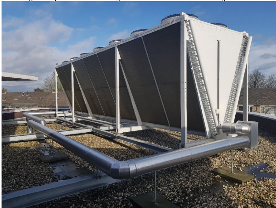
Afbeelding 1.2: Drycooler verduurzaming van het Franciscanessenhof in de gemeente Mierlo.

Daarnaast heeft Compaen in 2018 en 2019 diverse renovaties doorgevoerd in 54 woningen aan de Zeeltstraat in Helmond. Aanpassingen omvatten onder andere nieuwe gevels, extra dakisolatie, kozijnvervanging, vervanging CV-combiketels, vervanging mechanische ventilatiesystemen, schilderwerk, zonnepanelen en vernieuwing van keukens, badkamers en toiletten.