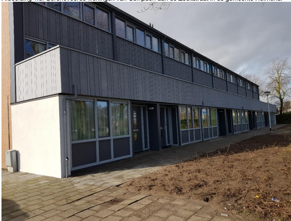
Afbeelding 1.3: Gerenoveerde woningen van Compaen aan de Zeeltstraat in de gemeente Helmond.

Compaen heeft voldaan aan de opgaven om de woningvoorraad op een actieve en innovatie wijze energetisch te verbeteren. Vanwege het uitgebreide en diverse scala aan afgeronde en opgezette projecten zijn twee pluspunten toegekend.