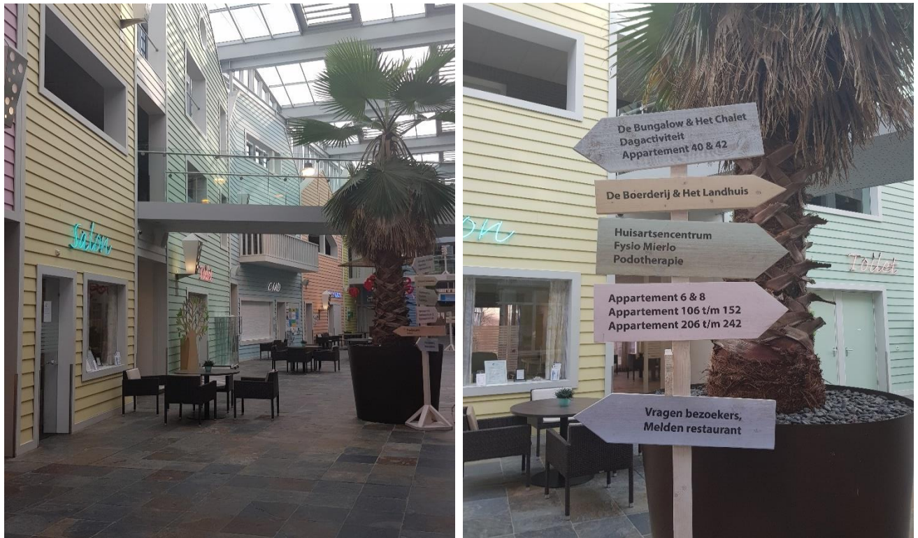
Afbeelding 1.5: Sfeervol atrium van woonzorgcentrum Hof van Bethanië waar Compaen in samenwerking met zorgorganisatie Savant zich inzet voor de zorgbehoevende en oudere doelgroep.

Tot slot heeft Compaen zich tijdens de visitatieperiode ook ingezet voor een ouderinitiatief, om achttien studio's te realiseren voor mensen met een verstandelijke beperking die nu nog bij hun ouders wonen. Zodat ook zij kunnen leren om zelfstandiger te wonen.